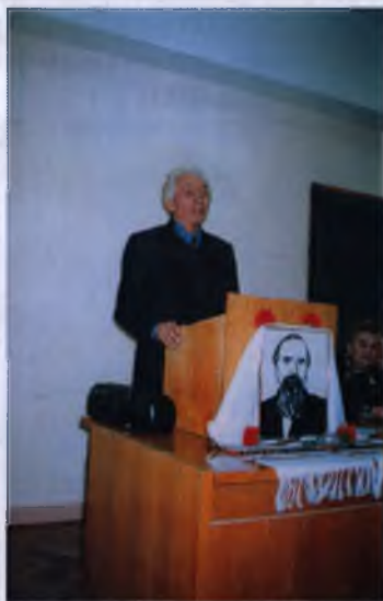
Ушанування пам'яті вченого-історика Івана Івановича Шевченка з нагоди 100-річчя з дня його народження (2003 р.)