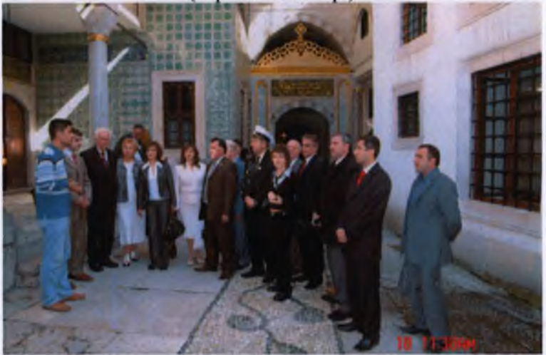
Учасники міжнародного наукового симпозіуму в Стамбулі у палаці Сулеймана Пишного та Роксолани (2007 р.)